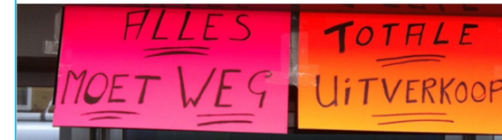
Bron: RTL Nieuws, 6 september 2015

Onderzoek: Lidl beste prijs/kwaliteitsformule