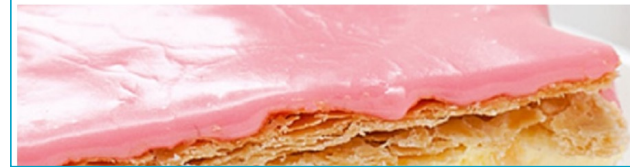
Bron: MarketingTribune, 21 april 2021

Hema stormt de Top 3 binnen van sterkste winkelmerken