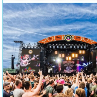
Bron: De Limburger, 4 juli 2018

04-07-2018 om 11:42 door AD/Sanne Scheffaut